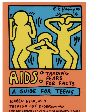
ポスター「エイズ：真実で恐怖をなくそう」1988年 Keith Haring Artwork ©Keith Haring Foundation Courtesy of Nakamura Keith Haring Collection