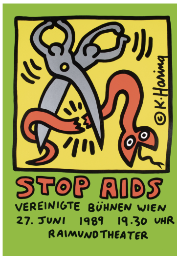
ポスター「ストップ・エイズ」1989年 Keith Haring Artwork