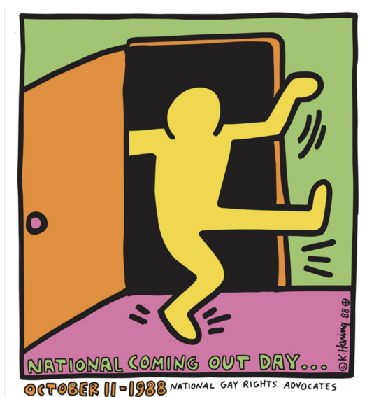
ナショナル・カミングアウト・デーのためのポスター、1988年

ナショナル・カミングアウト・デーのシンボルには、1988年にヘリングが制作した作品が採用されています。