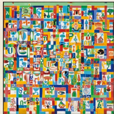
Ethiopian Calendar 2014

Admission: Adults ¥1,000/Seniors ¥900/Students ¥700/Ages 13 to 18 ¥500 Special discount available for people with disabilities