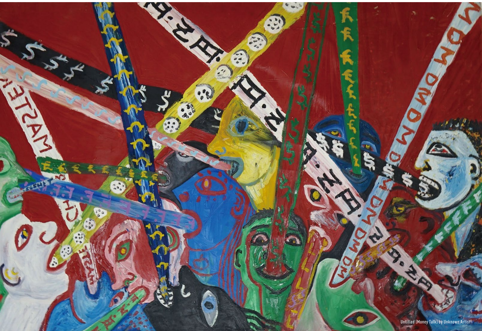
Untitled (Money Talk) by Unknown Artist