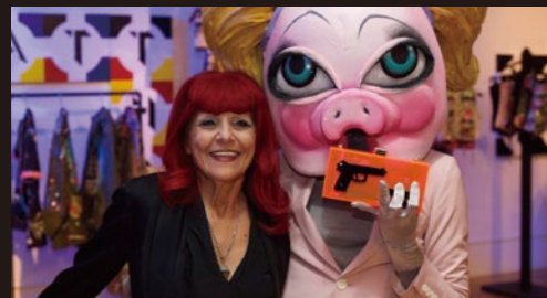
パトリシア・フィールド

*Art Brut translates as “raw art” coined by Jean Dubuffet in 1945 and can be described as Outsider Art)